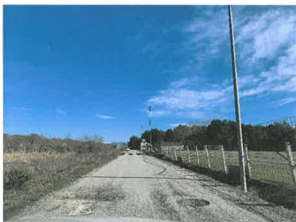
- Krpljenje rupa asfaltom