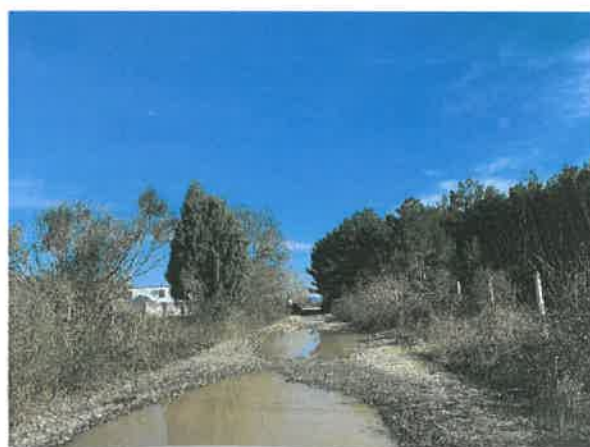
- dio koji treba tamponirati

Imajući u vidu da se radi o radovima koji predstavljaju adaptaciju i održavanje postojećeg objekta, to u smislu člana 5. tačka 1 i 15. Zakona o uređenju prostora i izgradnji objekata navodimo da se radovi izvode kao tekuće investiciono održavanje postojećeg stanja obale.